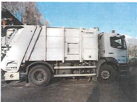
Slika 1: Obstoječe tovorno vozilo smetišnica, letnik 2005

Namen nakupa: ZAMENJAVA DOTRAJANEGA VOZILA