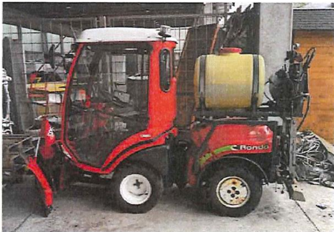
Slika 1: Traktor Carraro Rondo letnik 2010

Namen nakupa: ZAMENJAVA DOTRAJANEGA VOZILA