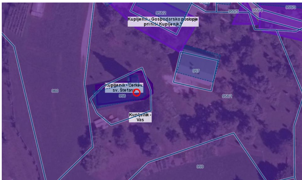
Slika 2: Izsek iz grafičnega prikaza Varstveni režimi kulturne dediščine eRKD