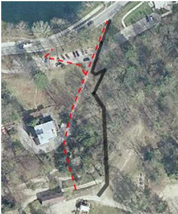
slika 2 - dostopna pot do Straže iz Ceste svobode