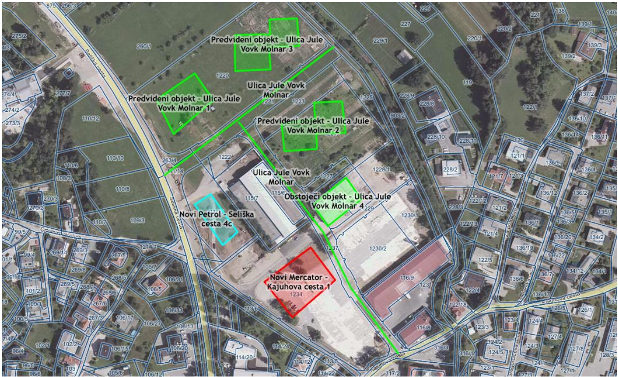
Ulica Jule Vovk Molnar